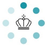
Illustration af princippet i et geotermisk anlæg